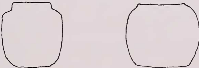
Fig 6.- Pronoto de B. martini (izqda.) y B. vulcania (dcha.)

De B. litoralis se separa por tener ésta el pronoto subsférico y sin escotadura; por carecer de dilatación en la zona media de la cara interna de los fémures y tibias; y por su edeago de ápice más redondeado, con los lados más convexos y de perfil más curvo.